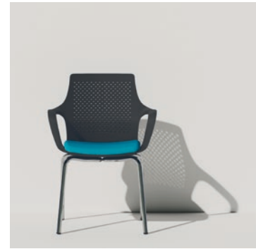
↑ Versione riunione con base a quattro gambe in tubo di acciaio cromato.